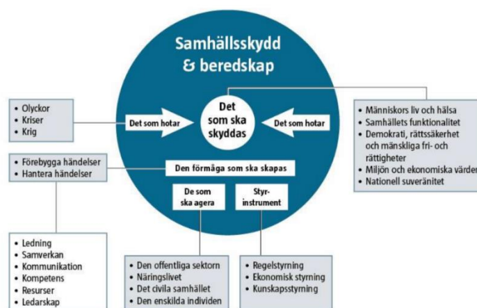
Figur 1.

Värnamo kommun verkar för en trygg och säker kommun för alla som bor, vistas och verkar i kommunen. För att nå framgång arbetar kommunen med ett helhetsgrepp om frågor som rör skydd mot olyckor och krishantering vilket sträcker sig från den vardagliga händelsen till höjd beredskap. Kommunen arbetar för att värna våra skyddsvärden. Det som ska skyddas är människors liv och hälsa, samhällets funktionalitet, demokrati och mänskliga fri- och rättigheter, miljö- och ekonomiska värden samt den nationella suveräniteten. Det som kan hota våra skyddsvärden kan vara allt från vardagliga händelser till händelser under höjd beredskap. För att värna våra skyddsvärden är det viktigt med ett förebyggande och proaktivt arbete där det skapas goda förutsättningar för att minska sannolikheten och konsekvensen för händelser samt att det skapas goda förutsättningar att minimera konsekvenserna vid händelser.