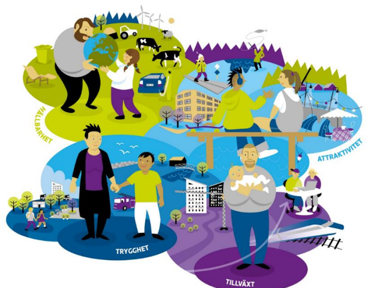
Figur 3. Illustration över kommunens målkriterier.