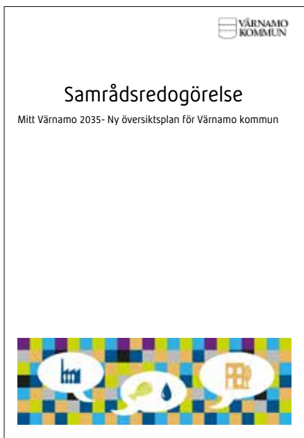
Bild som visar framsidan av Samrådsredogörelsen