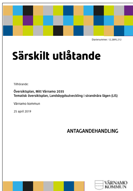
Bild som visar framsidan av det Särskilda utlåtandet.

synpunkten att planförslagets omfattning är för stor. Alla svarande grupper anser att det föreligger ett behov av att reducera omfattningen och antalet ställningstaganden.