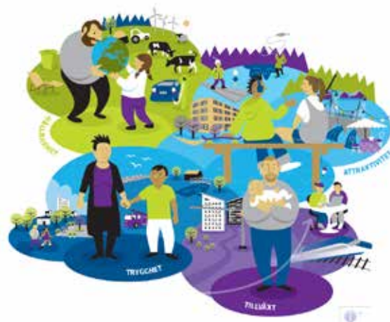
Illustration över kommunens vision och de fyra målkriterierna.

Kommunens vision konkretiseras i översiktsplanen genom fyra fokusområden: Attraktiv kommun, Goda kommunikationer, Utveckla mark- och vattenresurser och Främja hållbar näringslivsutveckling. Under varje fokusområde finns planeringsstrategier som förtydligar vilken utveckling som avses. Här får