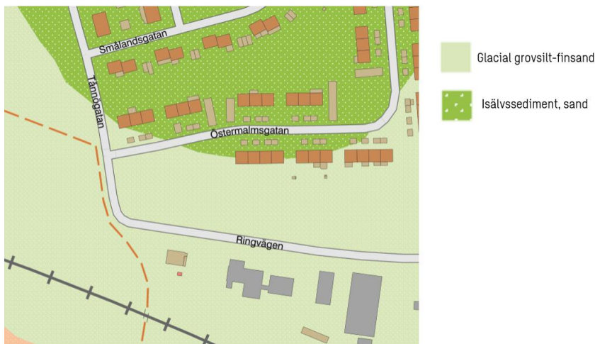
Figur 2. Översiktlig situationsbild för aktuellt område och dess jordarter. Undersökningsområdet ligger inom röd markering. Källa: SGU, 2024a.

inga brunnar som används för dricksvattenändamål i anslutning till undersökningsområdet.