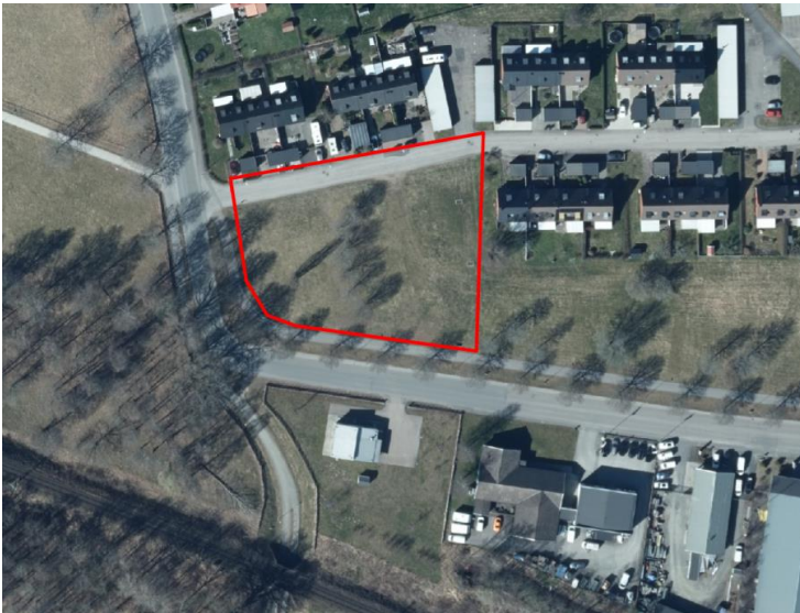
Figur 1. Flygfoto över aktuellt undersökningsområde. Undersökningsområdet ligger inom röd markering.

Fastigheten är idag detaljplanelagd för naturpark i enlighet med gällande detaljplan F148.