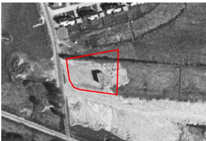
Figur 4. Flygbild från ca 1960 där det berörda området inom fastigheten Värnamo 14:66 ligger inom röd markering (Lantmäteriet 2024b).

Inom aktuellt område har det inte funnits några tidigare verksamheter. Enligt Lantmäteriets historiska flygfoton från ca år 1960 fanns det ett litet hus (Figur 4), detta fanns även kvar på historiskt flygfoton från ca år 1975.