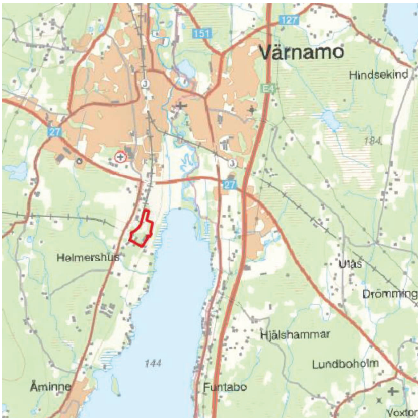
Figur 1 Översiktskarta med preliminärt planområde rödmarkerat. (Lantmäteriet)

Syftet med uppdraget har varit att få kunskap om föroreningsituationen i jord och grundvatten samt att översiktligt bedöma risker inför planerad planläggning av bostäder inom fastigheten.